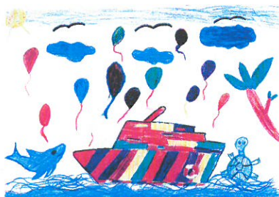
Aleksandra Piasek (7 lat) III miejsce w konkursie plastycznym